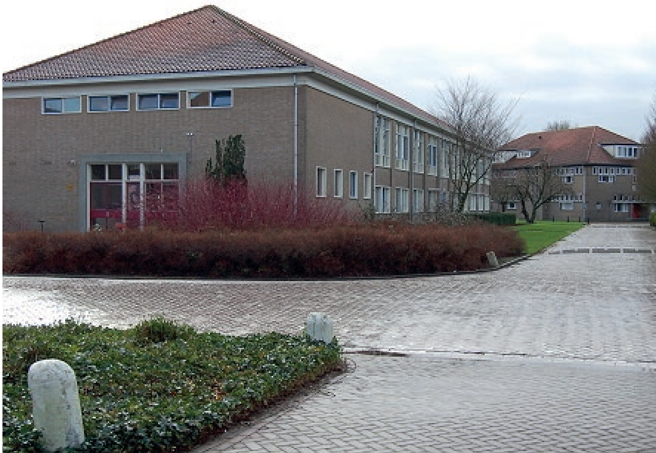
Gebouw 46 zoals het was.