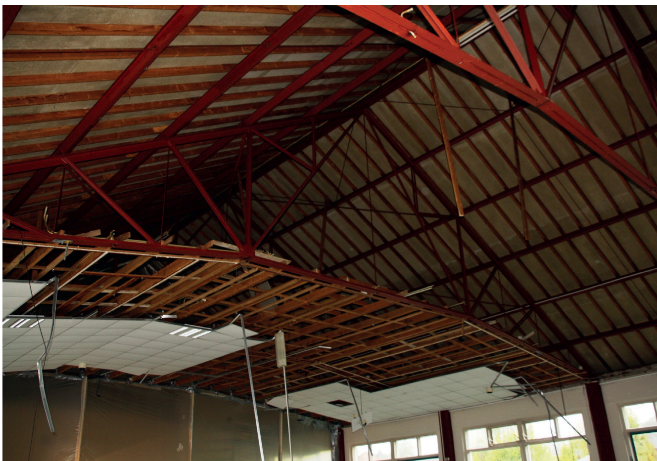
Binnenzijde half gesloopt.