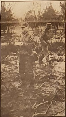
● Het voedsel mag dan niet helemaal gaar zijn, maar honger maakt rauwe bomen zoet.

Op dit terrein aangekomen (het is inmiddels al licht geworden) vervolgt de oefening met het inrichten van het bivak, zoals het opzetten van de tweepersonententjes en de camouflage, het graven van schuttersputjes, opzetten van de grote bivaktent (slaap- en eetplaats voor het kader: voornamelijk wachtmesters) en de aanleg van het drievatstelsel. Dit laatste is bedoeld voor het respectievelijk schoonmaken, ontameten en afspelen van het gebruikte bestek. Is alles in orde gebracht dan volgen er enkele uren rust.